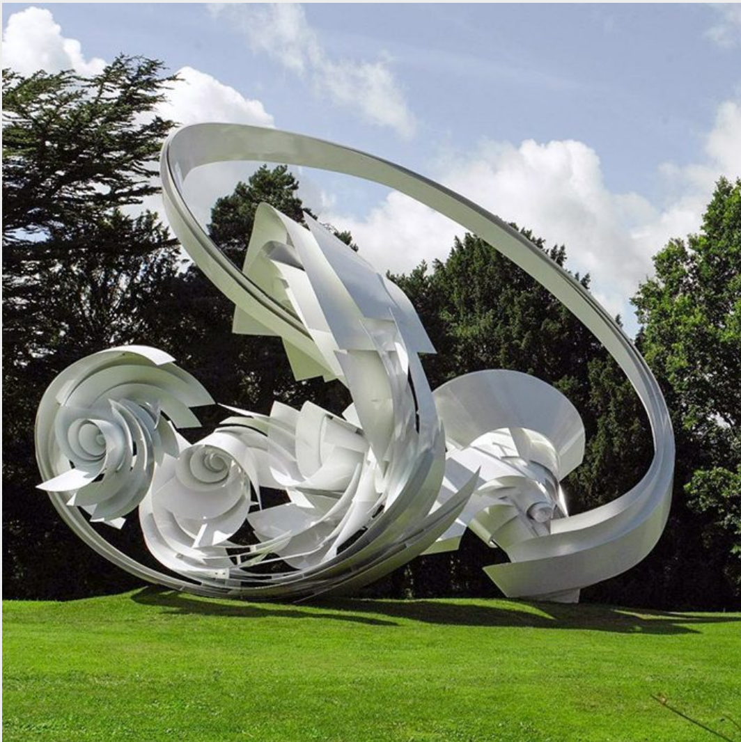
Foto: Temporarily installed at the Chatsworth House, Derbyshire, UK for Beyond the Limits: Sotheby's at Chatsworth, 2014. Reproduced by permission of Sotheby's. Courtesy Galerie Thomas Schulte.

Denna handledning riktar sig i första hand till lärare i åk. 7 - 9 och gymnasiet men kan anpassas till gymnasiesärskolan