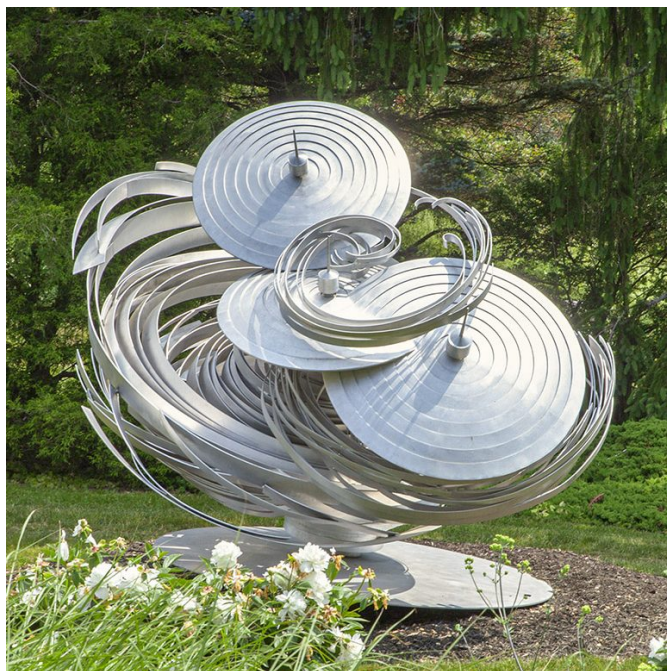
Foto: Berkshire Botanical Garden, MA, 2018, Courtesy Marlborough Gallery, NY