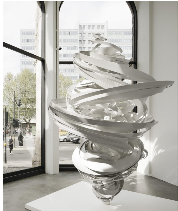
Foto: hiepler, brunier, ©2020 Alice Aycock Courtesy of Alice Aycock and Galerie Thomas Schulte, Berlin