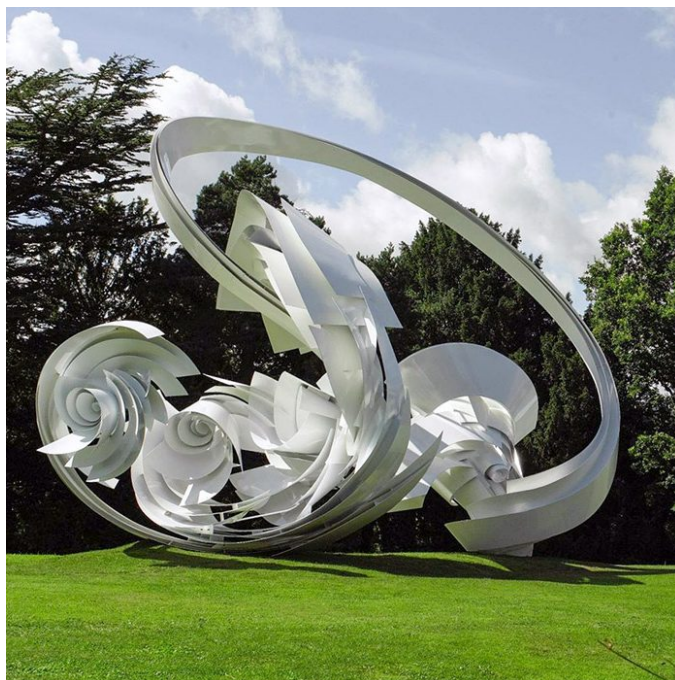
Foto: Temporarily installed at the Chatsworth House, Derbyshire, UK for Beyond the Limits: Sotheby's at Chatsworth, 2014. Reproduced by permission of Sotheby's Courtesy Galerie Thomas Schulte, Berlin