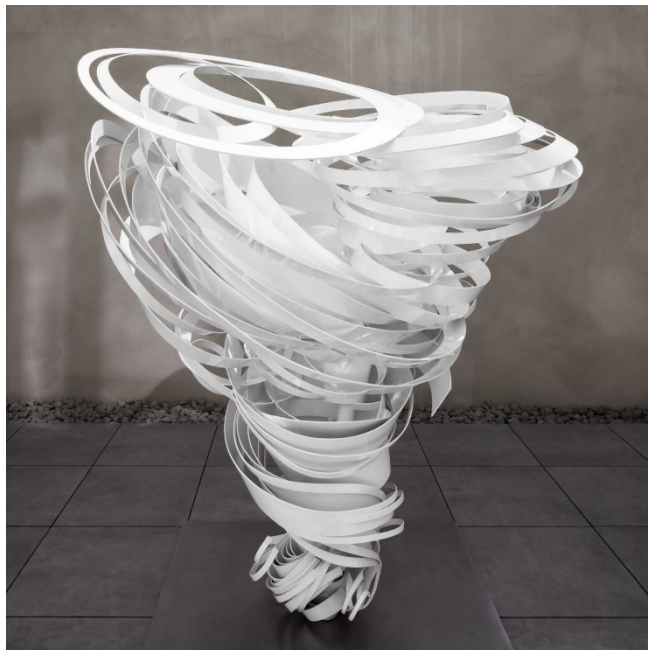
Foto: hiepler, brunier, ©2020 Alice Aycock. Courtesy of Galerie Thomas Schulte, Berlin and Marlborough Gallery, New York